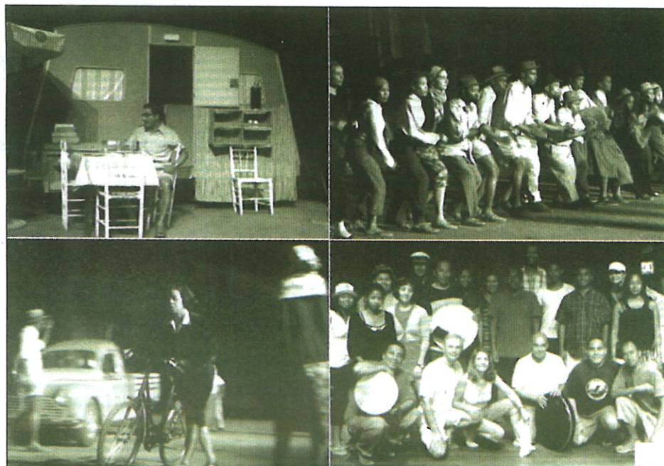
Opéra singulier, par son livret, "Chin" traite d'une histoire occultée et méconnue des DOM-TOM...

Réservation au 0262-41-93-25 ou sur www.theatreunion.re Tarifs: 22/19/15/10 euros