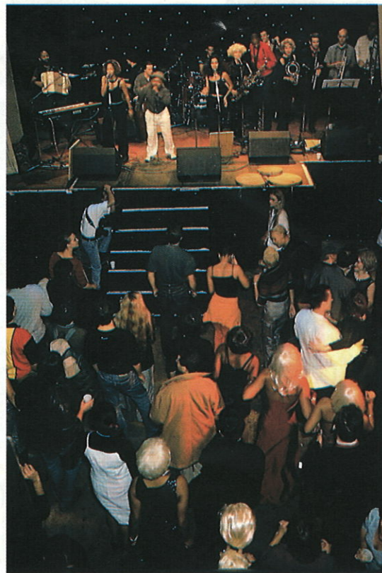
Une ambiance de folie lors de la soirée finale au Divan du Monde...