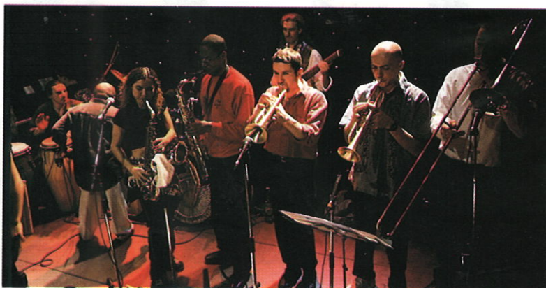
Un spectacle apprécié comme il se doit!