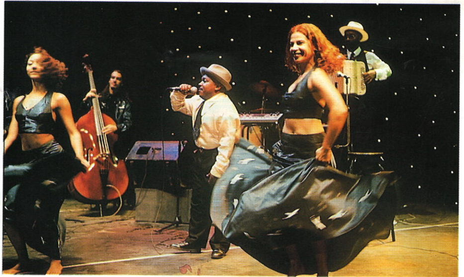
Le Théâtre Vollard a franchi un nouveau palier dans sa recherche théâtrale perpétuelle...