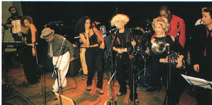
Une musique entraînante qui ne laisse pas indifférent...