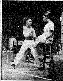
«Je ne suis pas une fille des îles!»

Séga Tremblad théâtre-concert au Divan du Monde 75 rue des Martyrs 75018 Paris (M° Pigalle) Informations ☎ 01 44 84 94 43 [14 sept. - 28 oct.]