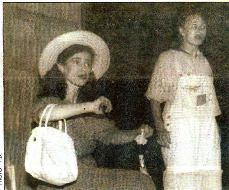
Les marmailles passent trois quarts d'heure devant cette pièce où sont réunis tous les ingrédients d'une bonne pièce.

Tropicadéro. Entre les distributions gratuites de pépito et les bonbons, les enfants ont surtout apprécié «José», la dernière création du théâtre Vollard. Un spectacle très rafraîchissant.