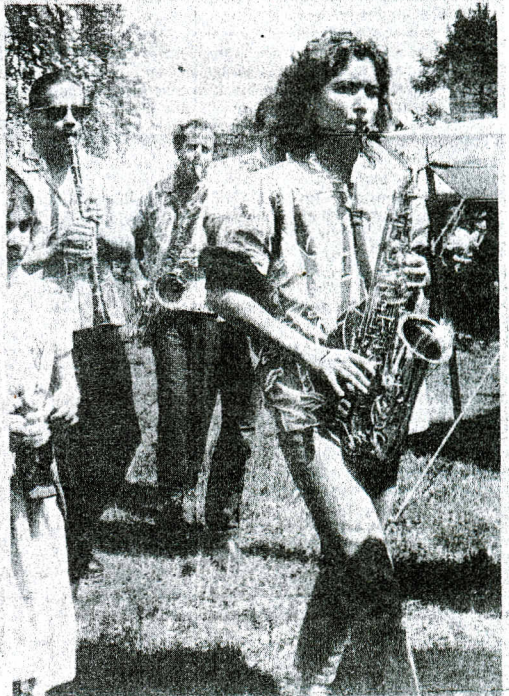
La fanfare créole a donné, à la fête, un air d'exotisme