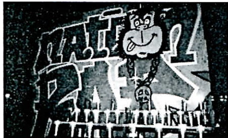
6 000 bougies ont brûlé au cours des deux soirées de vendredi et samedi.