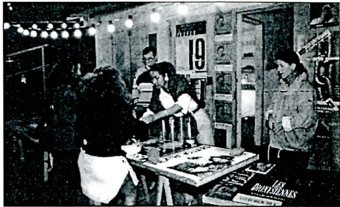
Sur le stand Volland, bougies et affiches en vente pour payer cette ultime soirée.