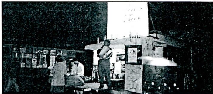
L'opération Mille bougies pour Jeumon associait le Cri du Margouillat, le Ti'Bird, le Théâtre Volland, Live et les plasticiens. Le secteur culturel non-institutionnel estime qu'il a droit à sa part du gâteau : il reçoit pourtant moins de 10% du financement de l'ODC.