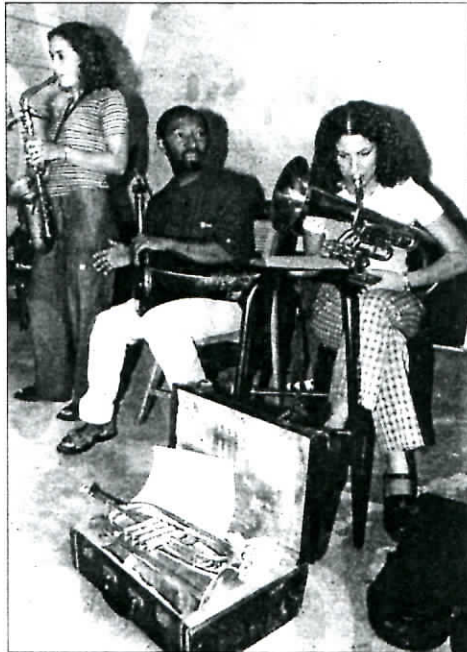
Volland reprend le chemin de la création. Acteurs et musiciens ont entamé les répétitions de «Séga Tremblad», une pièce à découvrir à compter du 10 décembre.

Ainsi que cet ouvrage sera vraisemblablement disponible à la fin du mois de novembre, la fête de Volland, mercredi prochain sera l'occasion de lancer une sous-