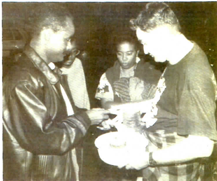
Les bougies, sont parties comme des petits pains.