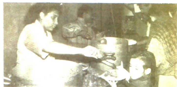
Ambiance bon enfant autour du cari.