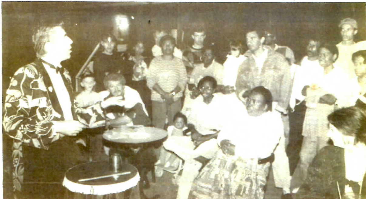
Les tours de magie ont fasciné petits et grands.

Et c'est vrai que la qualité de pièces comme Nina Ségamour, Leparvenche, et autre Millenium, sous l'égide du même Genvrin décerné plus haut, sont des réussites. C'est vrai aussi que le travail de Live, depuis plusieurs années, en direction de la musique locale est remarquable. C'est vrai que Jeumont reste un élément de poids dans la construction et dans la transmission de la culture à la Réunion. Alors ? Alors, les sous ne sont plus là. « Il faudra en arriver à partager l'argent comme on va en arriver à partager le travail.