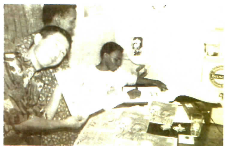
Les dessinateurs ont multiplié croquis et dessins